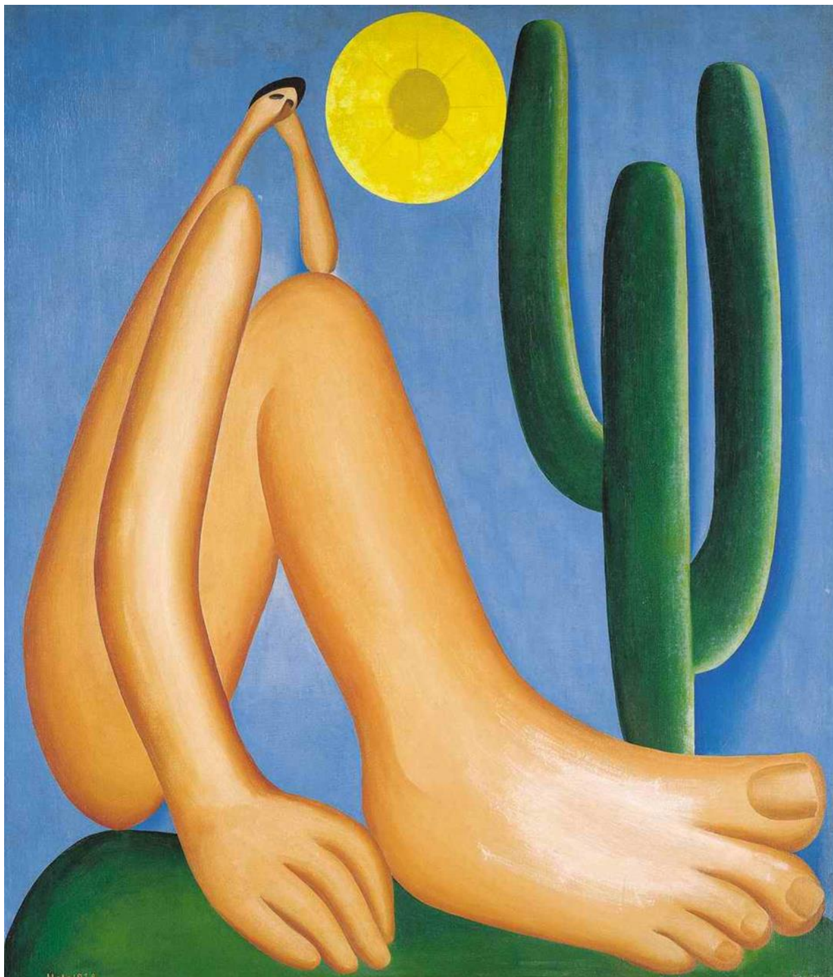
Tarsila do Amaral, Abaporu, 1928

A obra da artista modernista brasileira Tarsila do Amaral, “O Abaporu”, apresenta a classe operária, realidade vivida por muitos trabalhadores da roça, com suas mãos e pés deformados, remetendo-nos a uma época em que a indústria crescia e a diferença entre classes existia. Toda linguagem artística é reflexo de uma determinada época e a obra de Tarsila nos permite compreender o contexto da sociedade moderna ao incorporar, em sua criação, elementos da cultura brasileira.