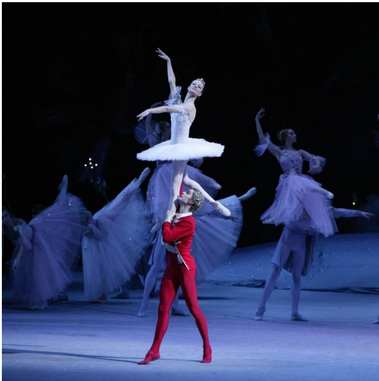
O Quebra-nozes, 1892, Balé Bolshoi.