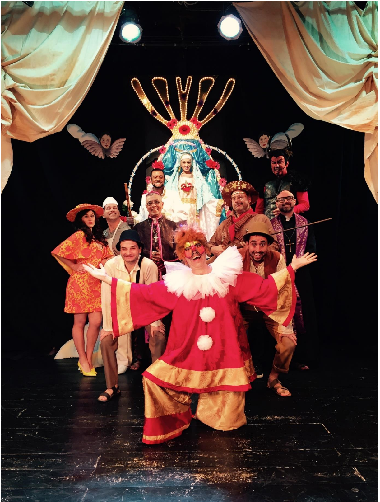
Suassuna, Auto da Compadecida, 1955.