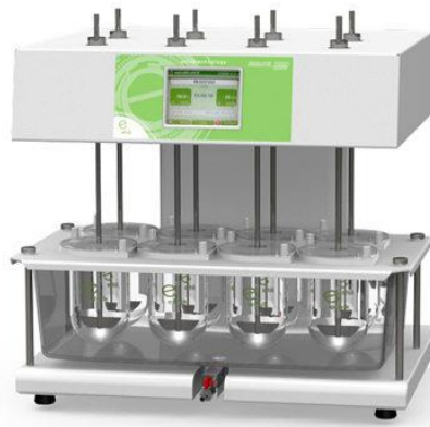
Figura 5: Dissolutor: Aparelho utilizado para porcentagem de liberação do fármaco.