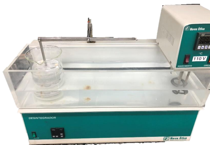
Figura 4: Desintegrador: Aparelho utilizado para verificar o tempo de desintegração do comprimido.

Para realização do teste, analisou-se 6 comprimidos, colocados separadamente em cada tubo do cesto do desintegrador (Figura 4), empregando solução tampão fosfato pH 5,8 como meio de desintegração, a temperatura de 37 \pm 1 °C (temperatura fisiológica). Acionou-se o aparelho por um tempo máximo de 30 minutos, que é o limite para desintegração de comprimidos não revestidos e observou-se em quantos minutos ocorreu a desintegração (BRASIL, 2019).