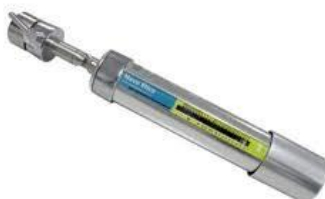
Figura 2: Durômetro: equipamento utilizado para avaliação da resistência mecânica.

O teste foi aplicado individualmente a 10 comprimidos após terem sido retirados quaisquer resíduos da superfície dos mesmos, eles foram submetidos à ação do durômetro que media a força, aplicada diametralmente, necessária para esmagá-los. O resultado foi expresso como a média dos valores das determinações. De acordo com a farmacopeia brasileira, é um teste apenas informativo, sendo desejável uma resistência mínima de 3 kgf (BRASIL, 2019).