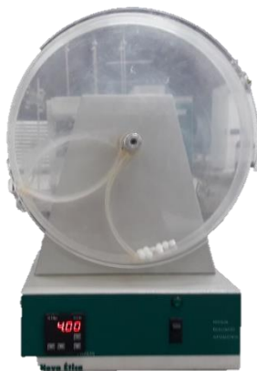
Figura 3: Friabilômetro utilizado para avaliação da resistência mecânica de comprimidos.

A friabilidade é um teste aplicado a comprimidos não revestidos que determina a resistência à abrasão quando submetidos ao friabilômetro (Figura 3), um aparelho específico para a realização deste teste.