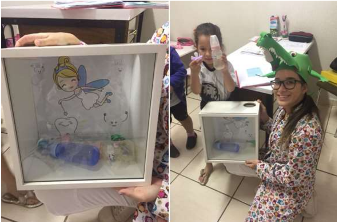
Figura 4: Caixa porta chupeta e mamadeira

A explicação dos malefícios de uma forma simples e lúdica promoveu uma compreensão de que eles já não necessitam mais desses hábitos nocivos. Para isso foi utilizada uma caixa de madeira lúdica, onde as crianças colocaram suas chupetas e mamadeiras.