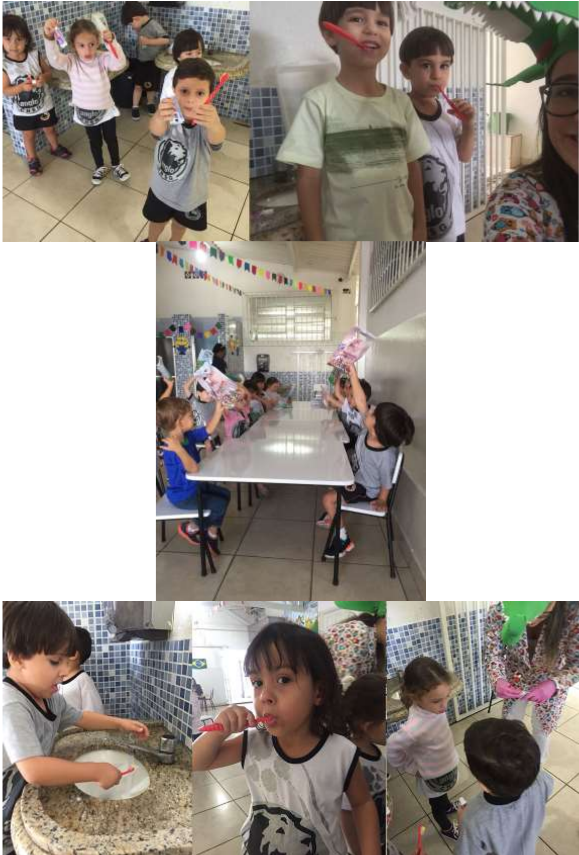
Figura 5: Orientação de escovação