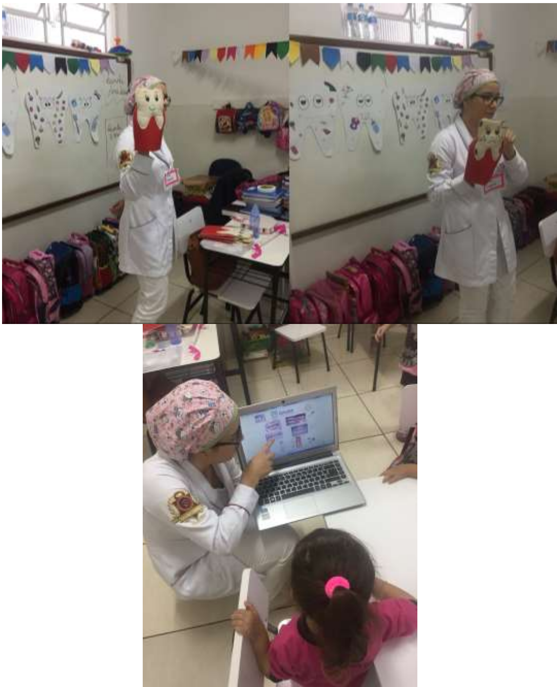
Figura 2: Teatro com fantoches

O teatro teve o intuito de demonstrar o que era a cárie e como era a sua evolução. De forma pedagógica e lúdica foi possível despertar a curiosidade e o interesse em aprender a remover e não deixar o “bichinho” da cárie se propagar na cavidade oral. Além do teatro foram utilizadas algumas imagens mostrando a doença cárie.