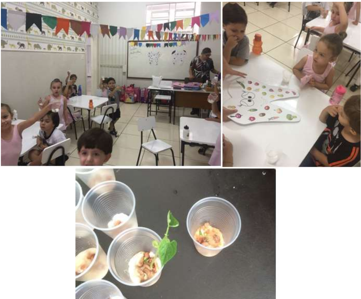
Figura 3: Plantando feijão no potinho

O tema alimentação saudável foi abordado com a experiência, desenhos, história e brincadeiras.