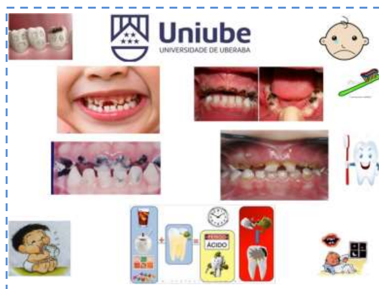
Figura 1: Modelos de folhetos ilustrativos

Foram confeccionados folhetos ilustrativos e lúdicos para abordar os temas relacionados à cárie, cárie de mamadeira, alimentação saudável, hábitos nocivos e a forma adequada de escovação. Estes folhetos foram entregues às crianças, ao mesmo tempo em que se discutia e explicava cada tema abordado (Fig. 1).