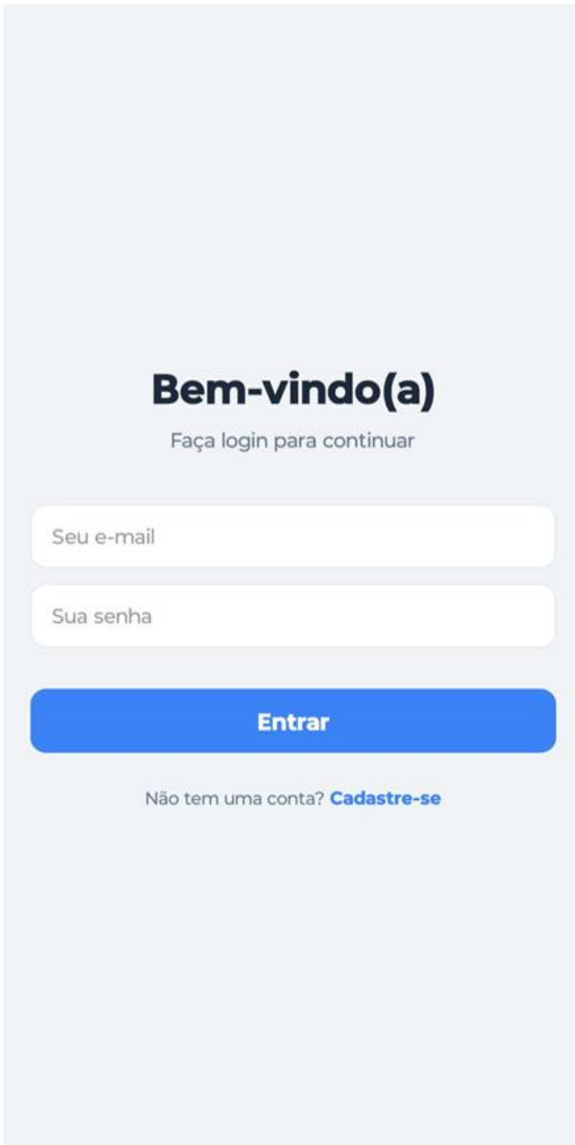
Figura 1 - Tela de Login