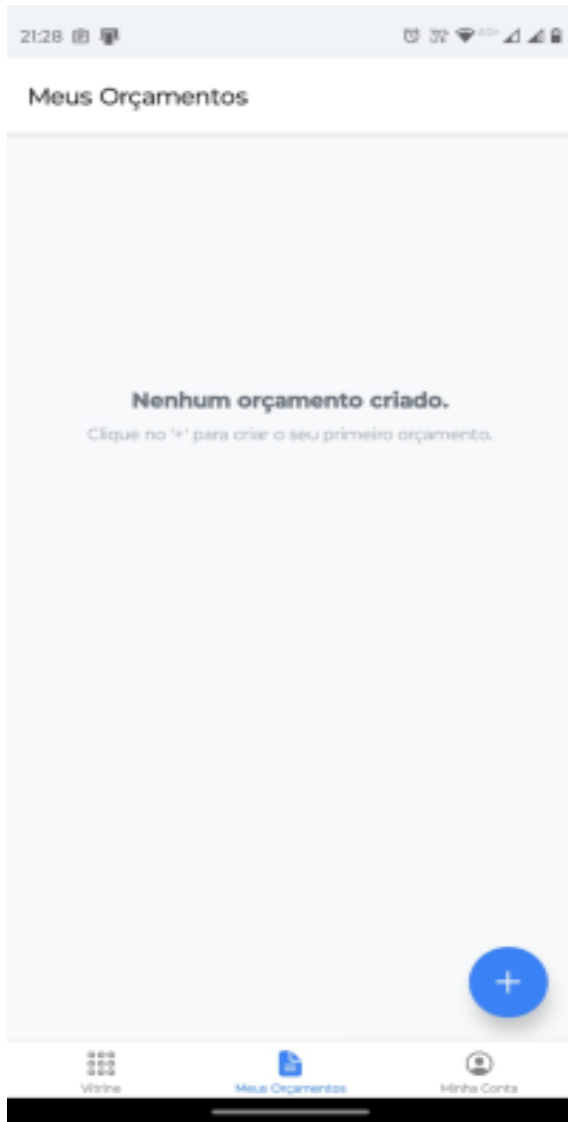
Figura 3 - Menu de orçamentos