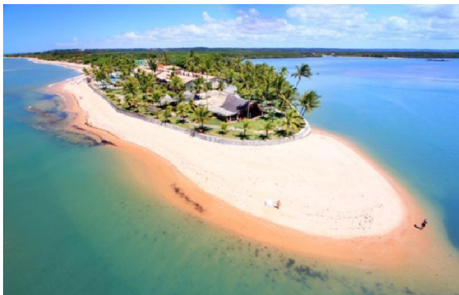
Figura 17: Arraial d'Ajuda