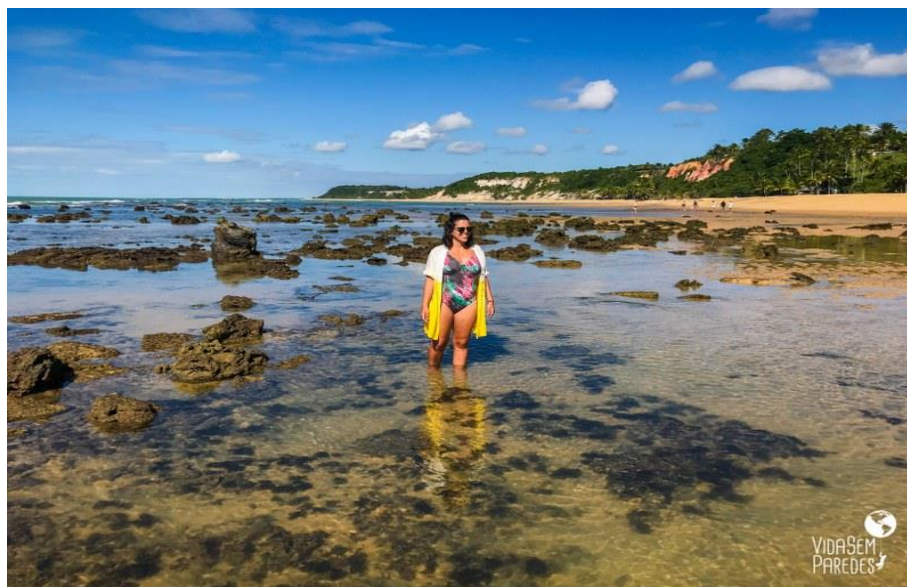
Figura 15: Praia do Espelho

Estas praias são espaços virtuosos os quais denotam rara beleza em seu patrimônio natural. Possui ainda uma rica vegetação ainda intocada.