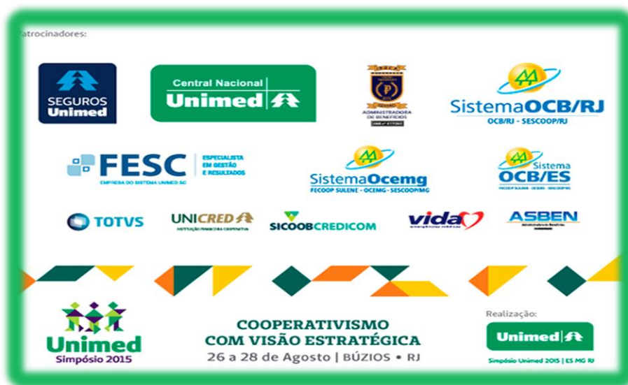
Figura 2: Simpósio Unimed