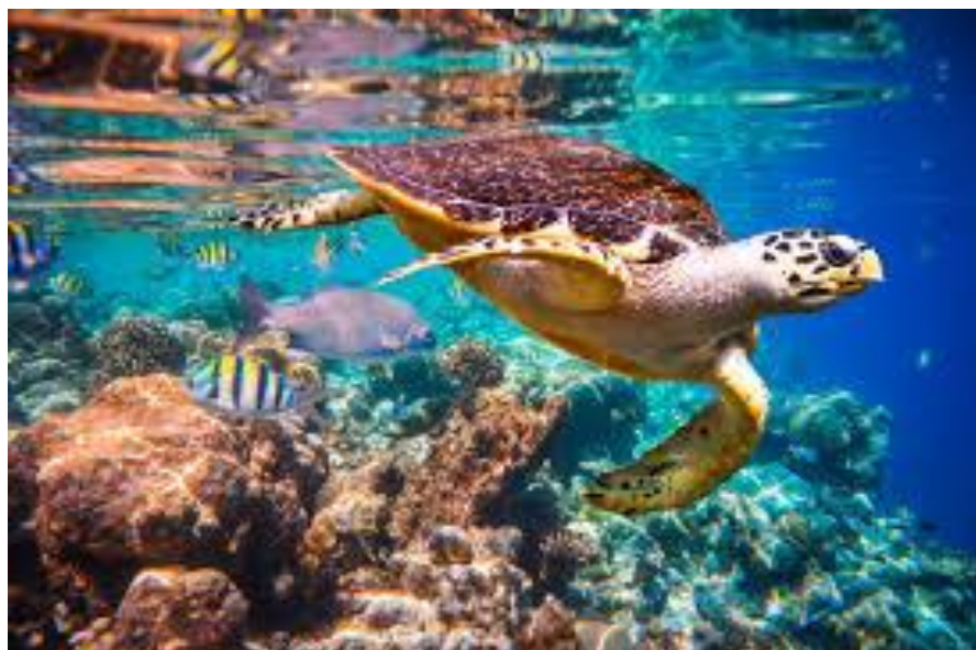
Figura 19: Tartaruga projeto TAMAR