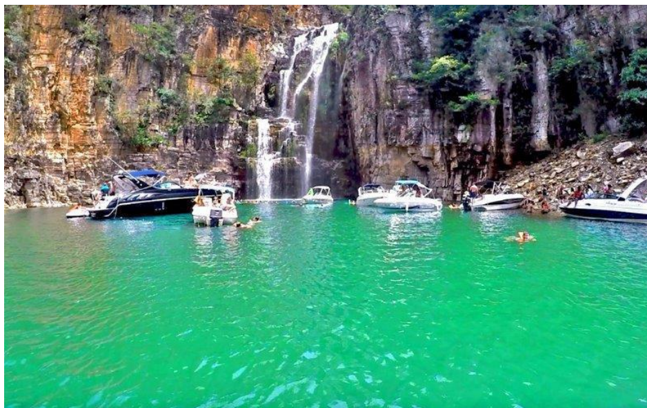
Figura 20: Atividade náutica em Capitólio