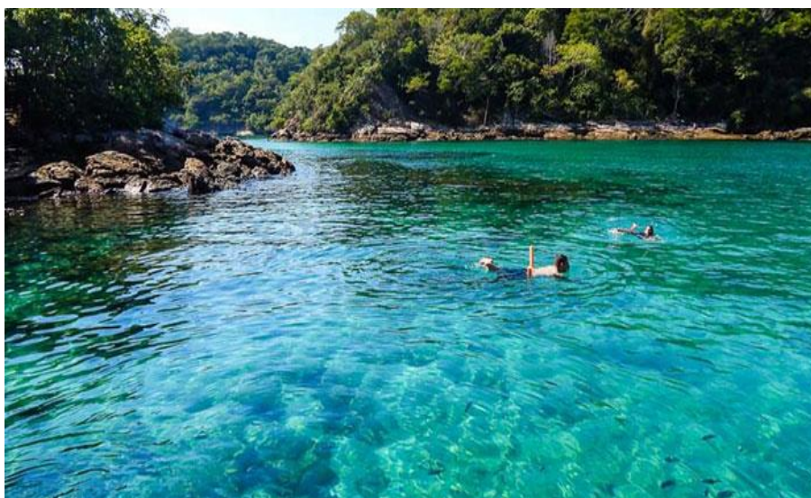
Figura 10: Lagoa Azul

Algo efetivo, porém que não passa despercebido seria o fato da tripulação, ainda em espaço atracado informar aos viajantes as questões pertinentes à segurança em caso de pane ou acidentes que porventura possam ocorrer durante o trajeto.