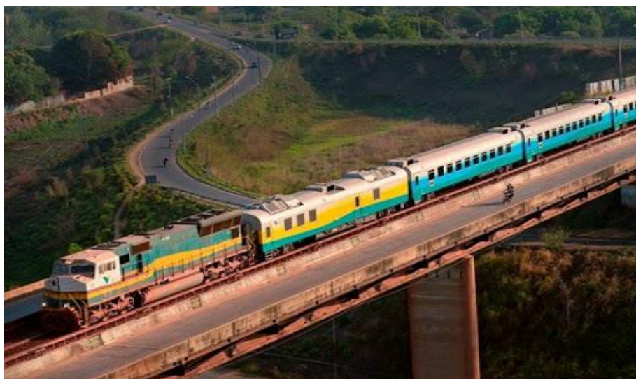
Figura 5: Trem de passageiros da Vale

Outro fato que chamou a atenção é o desempenho da Vale, no que diz respeito a SST - Segurança e Saúde do Trabalho, programa em que a organização prima pela seriedade bem como a complexidade e precisão, no controle extremo, por vezes, via internet sem fio, utilizando sistema digitalizado que surpreende o grupo.