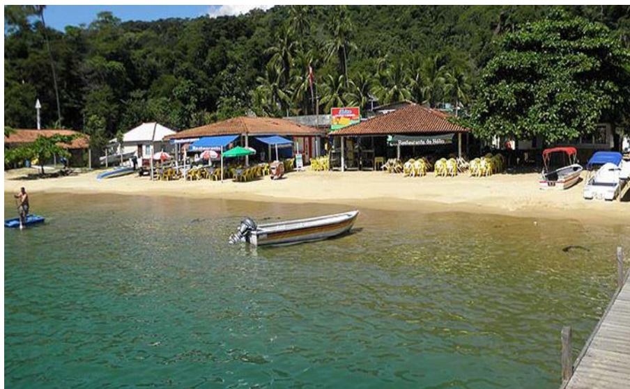
Figura 13: Praia Japariz

Esta é uma das mais ricas visitas que o Turismo Pedagógico pode proporcionar para seus discentes. O grupo tem a oportunidade de perceber questões ambientais, gestão, segurança do trabalho, segurança náutica bem como logística. Além é claro para turmas do Direito verificar as questões vinculadas ao arcabouço legal que tratam da preservação ambiental, matéria estudada na Disciplina Direito Ambiental.