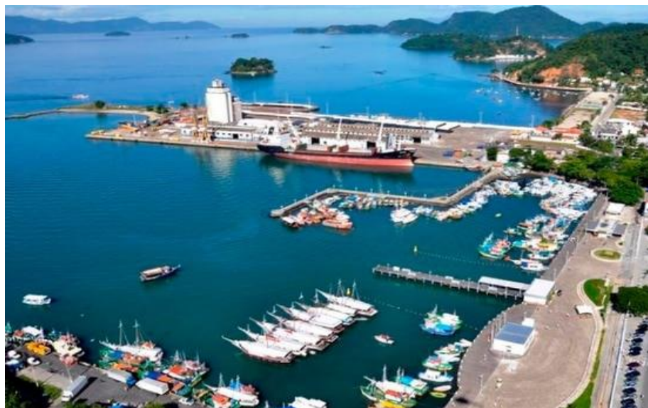
Figura 18: Estação portuária Technip / Angra dos Reis