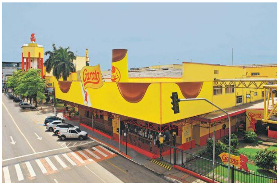
Figura 4: Fábrica da Garoto / ES