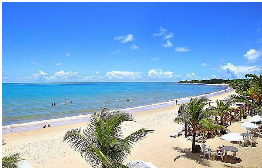
Figura 16: Praia Coroa Vermelha / Mutá