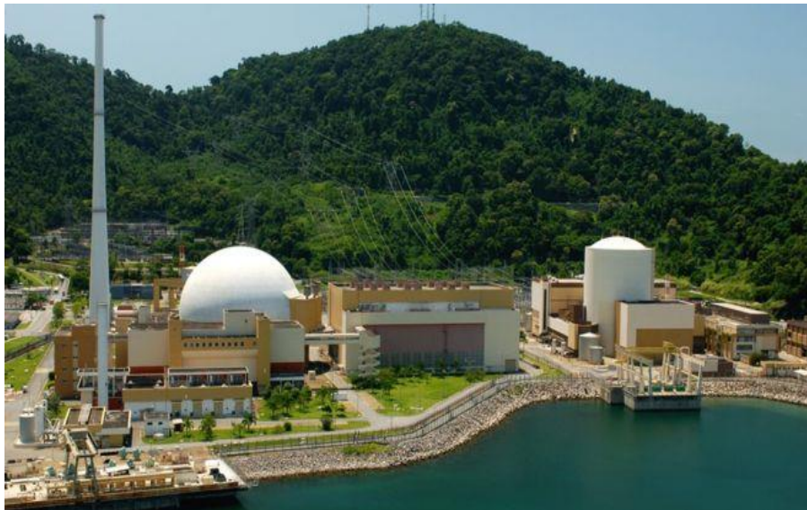
Figura 6: Usina Nuclear de Angra dos Reis

O Turismo Pedagógico neste caso desfruta da possibilidade de apresentar ao discente o natural e o tecnológico convivendo em harmonia. Parte do sistema hídrico que compõe a bacia da região é que refrigera todos os sistemas onde se processa a energia, sendo devolvida ao mar somente após filtragem e retorno a temperatura ambiente.