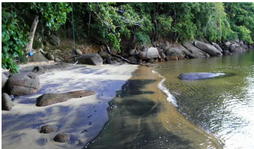
Figura 11: Praia da Baleia

Aos alunos é oferecido neste espaço amplo conhecimento vinculado a questões ambientais, preservação ambiental, importância da formação de corais que se aglomeram nas rochas.