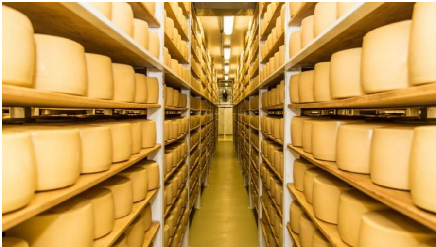
Figura 8: Armazenamento de queijo