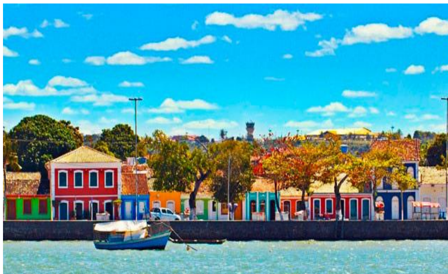
Figura 14: Porto Seguro / BA

Com uma ruma riquíssima de patrimônios, existentes em solo brasileiro, é possível verificar que os guias desvelam a história a partir do uso de objetos contidos neste acervo. Além das visitas guiadas é possível conhecer também uma bela paisagem na APA - Área de proteção Ambiental de Porto Seguro – BA.