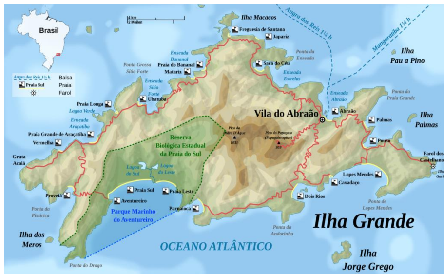
Figura 9: Mapa de Ilha Grande

Ilha Grande faz parte da Costa Verde do Rio de Janeiro, configurando um cenário paradisíaco e apaixonante. Cercada por águas claríssimas e cardumes com suas cores sensacionais, a Ilha Grande possui uma área de 193 km 2 . São praias com pequena extensão de areia sendo que algumas delas coexistem água doce e salgada.