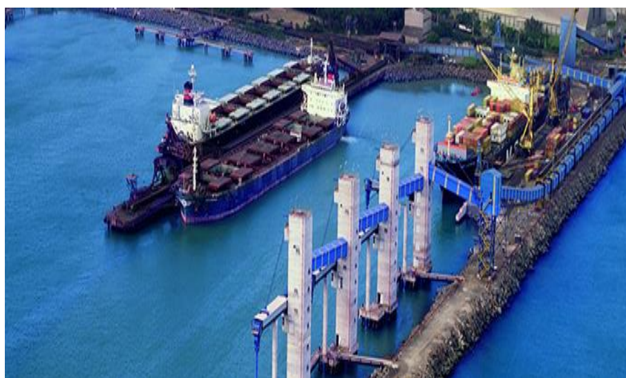
Figura 19: Porto de Tubarão (ES)