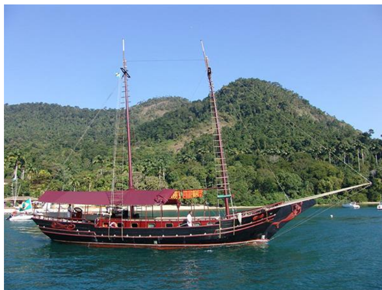
Figura 21: Passeio de Escuna em Mangaratiba