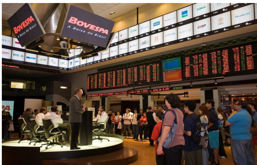
Figura 1: Bolsa de Valores - BOVESPA