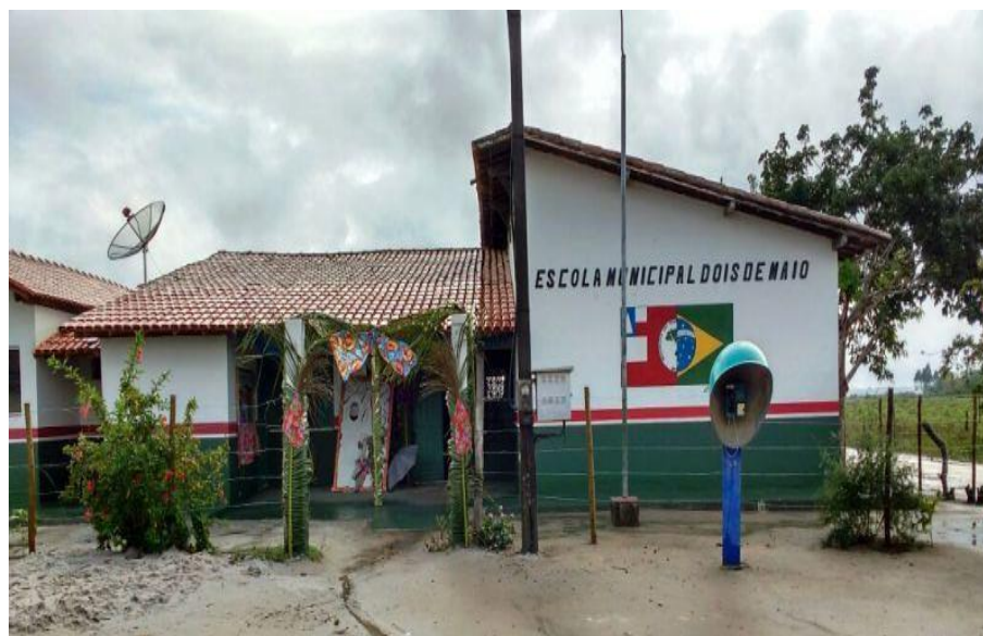
Figura 7: Assentamento Chico Mendes 2 / BA