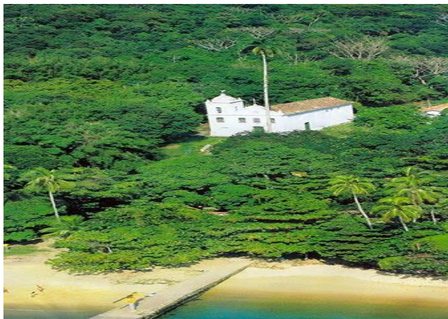
Figura 12: Freguesia de Santana