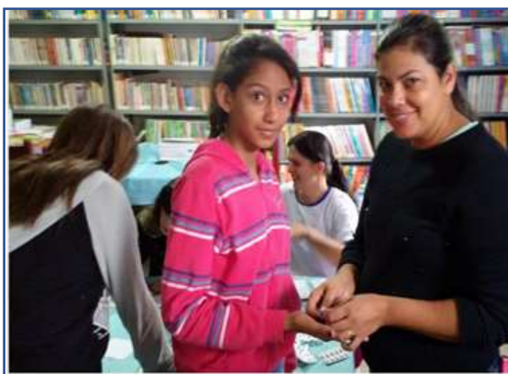
Fotografia 3: Aplicando a prática escolar

Com base numa construção participativa, compreende-se a necessidade de implantar medidas que previnam o acometimento de doenças na sociedade, prevalecendo uma aprendizagem que possa ter sentido em transformar a vida das pessoas que compoem a comunidade escolar, exemplificando por meio de atividades que intensificam as práticas educacionais em saúde.