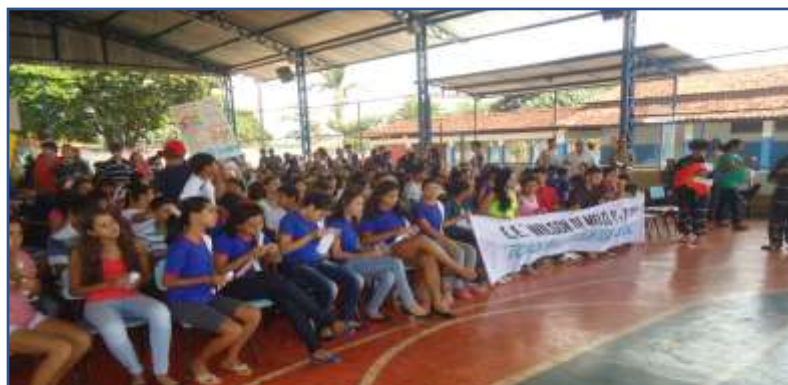
Fotografia 2: Conscientização com cartazes e Panfletos