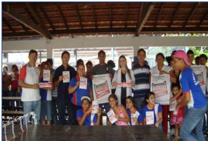
Fotografia 1: Conscientização com cartazes e Panfletos

nos corpos hídricos, deixar caixa d'água destampada, entre outros). Essa intervenção contou com a contribuição dos setores de vigilância sanitária, PSF(s)- agentes de saúde, farmacêutica, gestores, diretores, professores, familiares e alunos, conforme se observa nas fotografias 1 e 2.