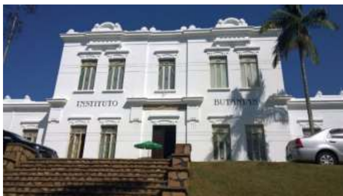
Figura 02 Instituto Butantan