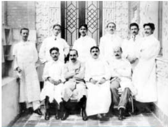
Figura 5: Médicos sanitaristas em Manguinhos, RJ.