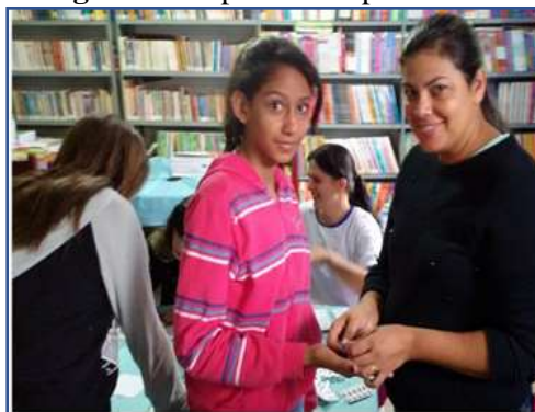
Fotografia 3: Aplicando a prática escolar

Dando continuidade, trabalhou-se as questões de saneamento básico, apresentando os números em relação às regiões mais incidentes e de baixo desenvolvimento sanitário, em seguida, como medida de intervenção para o espaço escolar, após realizar todo o momento introdutório e interpretativo da campanha, realizou-se a administração de Albendazol 400mg em todos os alunos dos anos finais do ensino fundamental e sob a autorização dos pais, este medicamento foi fornecido pela “farmácia de todos” do município de Centralina-MG, atendendo as medidas de prevenção da Campanha Nacional de Hanseníase, Verminoses e Tracoma. Essa intervenção contou com a contribuição dos setores de vigilância sanitária, PSF(s)- agentes de saúde, farmacêutica, gestores, diretores, professores, familiares e alunos, conforme se observa nas fotografias 3 e 4.