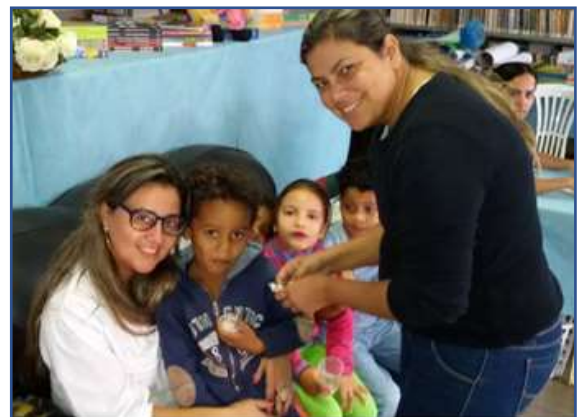
Fotografia 4: Aplicando a prática escolar