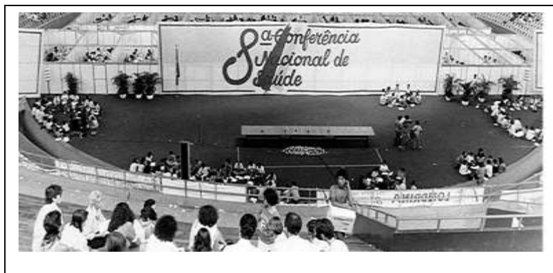
Figura 6: 8ª conferência Nacional de Saúde