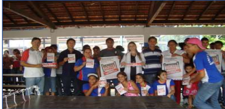
Fotografia 1: Conscientização com cartazes e Panfletos