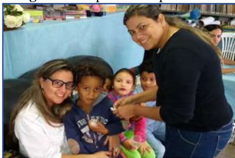
Fotografia 4: Aplicando a prática escolar