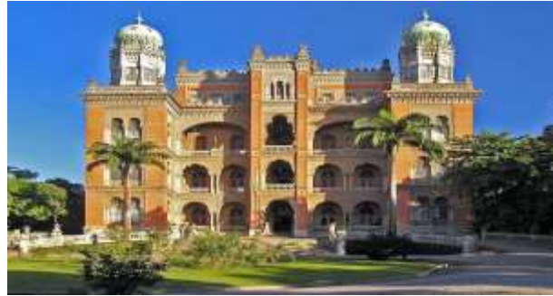
Figura 3: Instituto Oswaldo Cruz