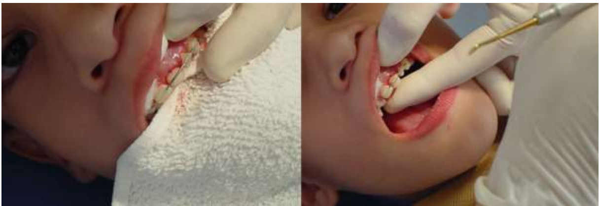
Figura 3: Reposicionamento e imobilização do dente 61 após o trauma.

O tratamento de escolha foi o reposicionamento e imobilização do dente com pressão digital e com uma contenção de fio ortodôntico semirrígido e resina composta para obter uma melhor cicatrização do ligamento periodontal, mantendo a integridade estética e funcional do elemento por meio da estabilização em sua posição anatômica correta.