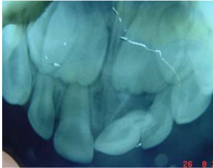
Figura 2: Imagem radiográfica do paciente de 4 anos após o trauma de luxação extrusiva.

O tratamento de escolha foi o reposicionamento e imobilização do dente com pressão digital e com uma contenção de fio ortodôntico semirrígido e resina composta para obter uma melhor cicatrização do ligamento periodontal, mantendo a integridade estética e funcional do elemento por meio da estabilização em sua posição anatômica correta.