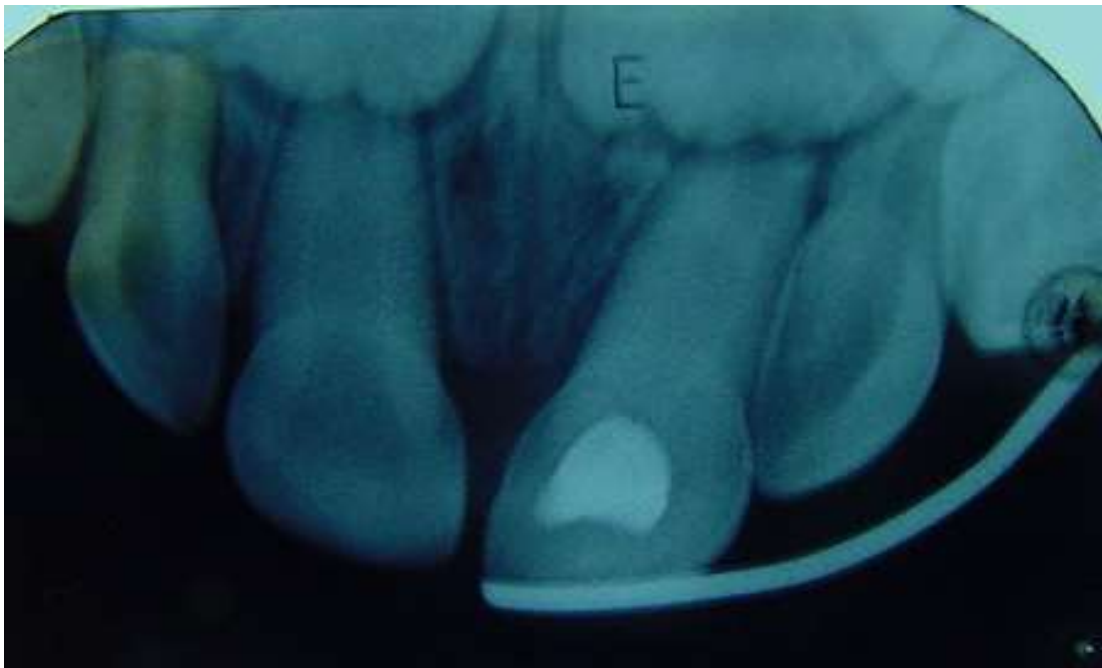
Figura 5: Aspecto radiográfico do dente 61 após o reposicionamento e imobilização.