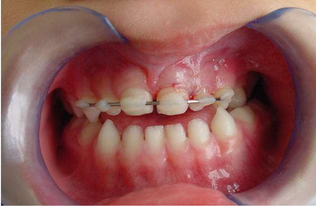
Figura 4: Aspecto clínico após o reposicionamento e imobilização do dente 61.