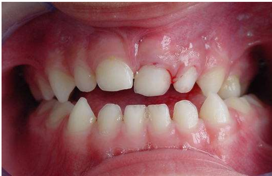
Figura 1: Aspecto clínico do dente 61 após trauma de luxação extrusiva em paciente de 4 anos.

O exame clínico mostrou que o paciente apresenta somente dentição decídua, com uma lesão no elemento 61. Observou-se um deslocamento parcial do dente em relação ao alvéolo, presença de sangramento e mobilidade.