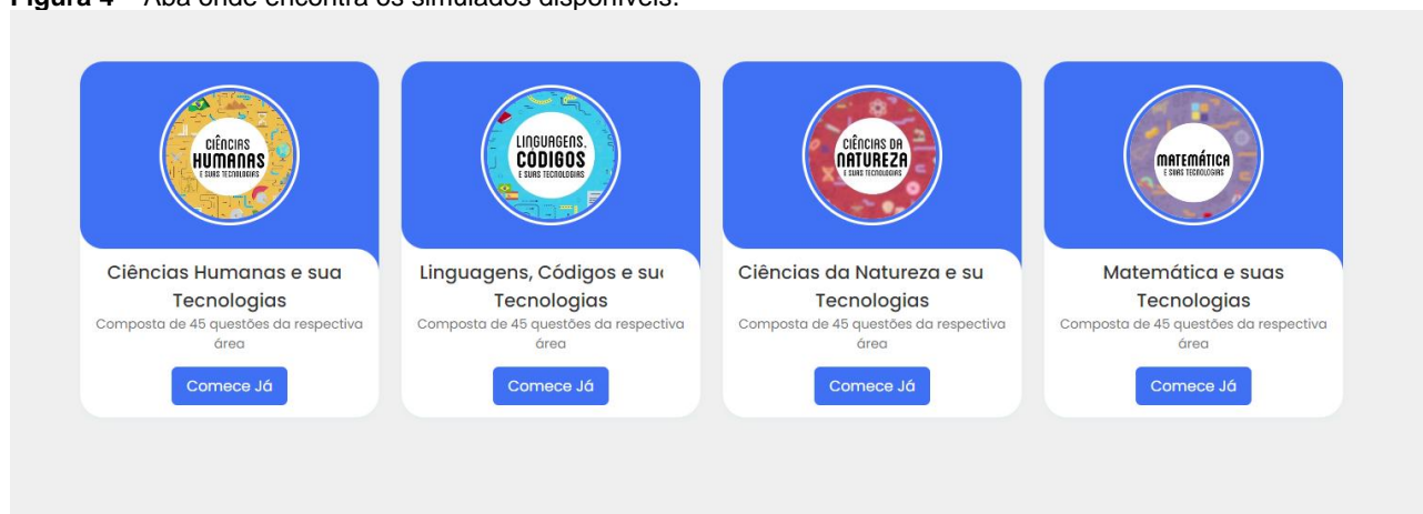
Figura 4 – Aba onde encontra os simulados disponíveis.

Na figura 4 – Captura da aba de simulados, onde vai ter a possibilidade de selecionar o tipo de prova a ser simulada pela plataforma.