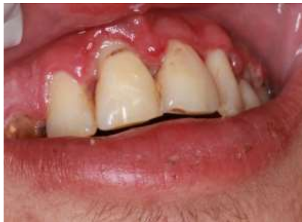
Fotografia 2: Gengiva ântero-superior vestibular.