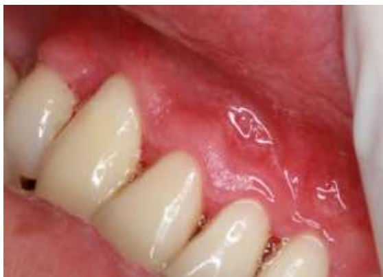
Fotografia 5: Proservação por uma semana.