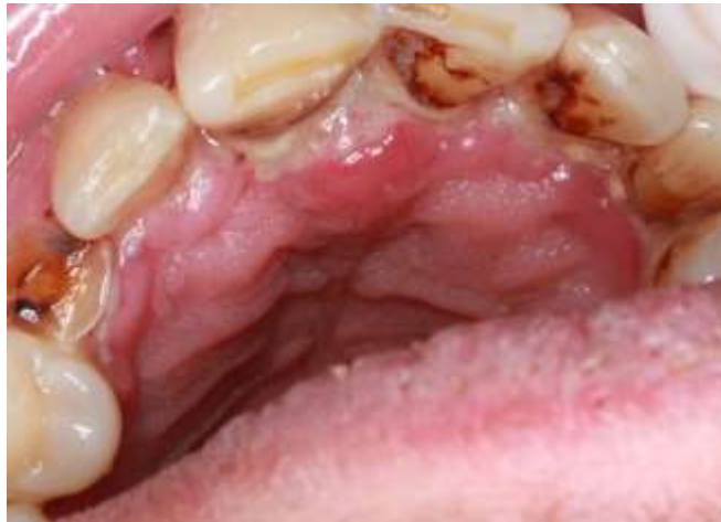
Fotografia 4: Gengiva palatina anterior.