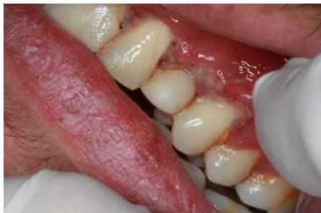
Fotografia 3: Gengiva vestibulo-posterior.