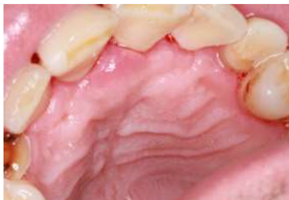
Fotografia 6: Proservação por uma semana.