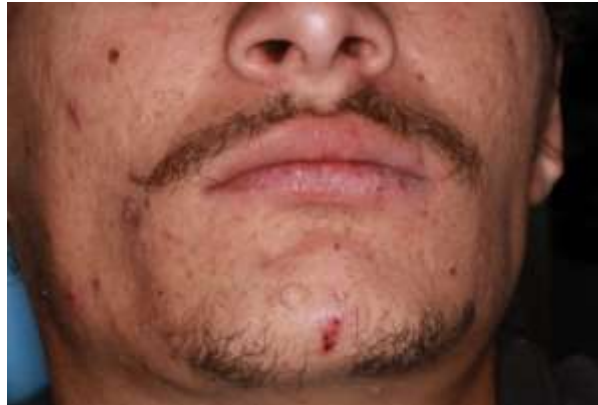
Fotografia 1: Aspecto extrabucal.