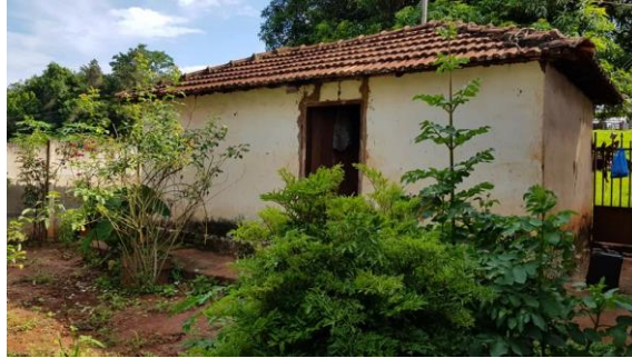
Figura 2 – Casa da família – Município de Ituiutaba.