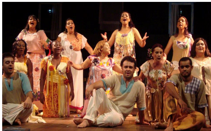
Figura 4 - Grupo Vocal Art-in-cena – Espetáculo Tons de Milton Nascimento