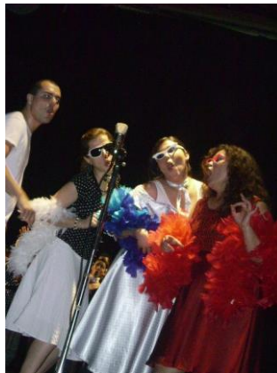
Figura 3 - Grupo Vocal Art-in-cena Espetáculo Anos 60