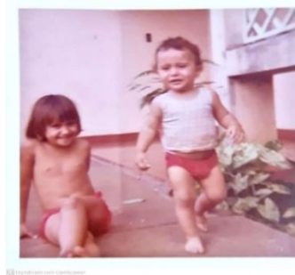
Figura 1 - Irmãos.